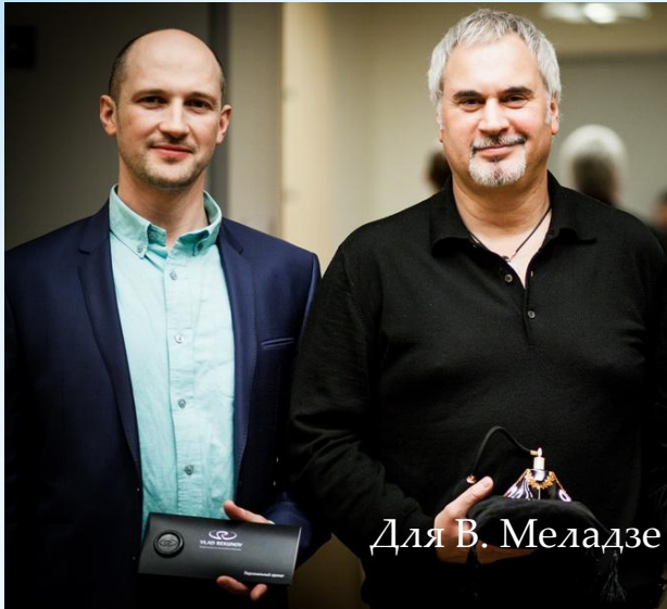
Для В. Меладзе