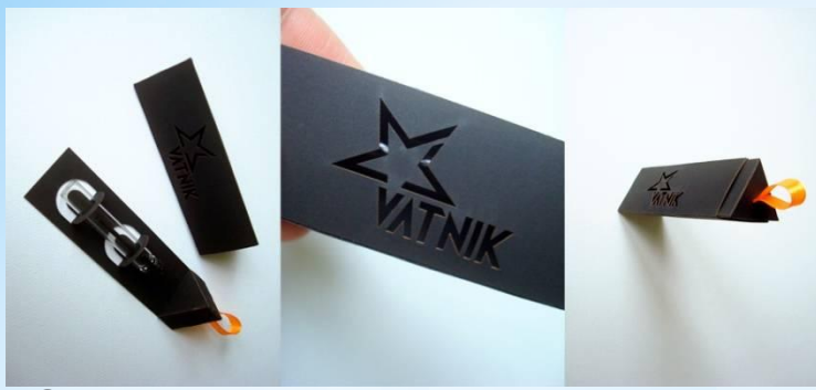
Сопровождение ароматом коллекции дизайнера одежды