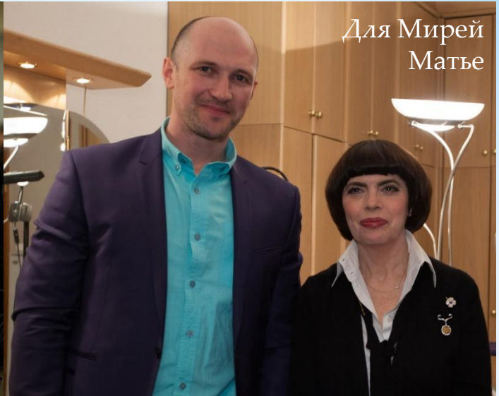
Для Мирей Матье