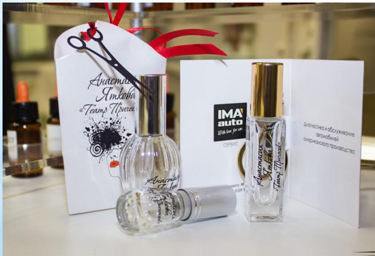
Варианты промо-материалов с ароматом бесконечны