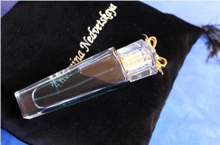
Подарок каждому гостю презентации салона